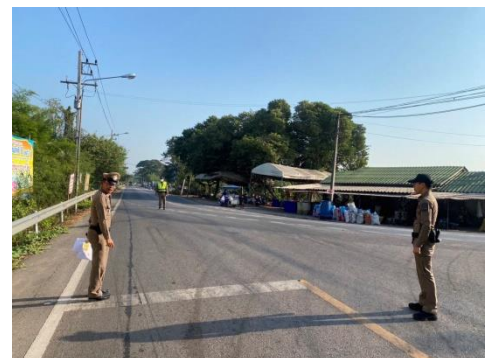
ประสานแขวง ติดตั้งป้ายหยุดเส้นทางไปบ้านโรงเข้ ซึ่งเป็นเส้นทางรองที่จะเข้าทางหลัก และทาสีตีเส้น