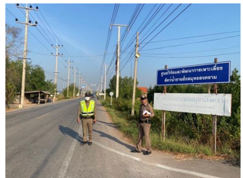
ประสานแขวงติดตั้งสัญญาณไฟกระพริบบริเวณทางแยกเข้า ศูนย์วิจัยและพัฒนาสัตว์น้ำชายฝั่ง สส. และทาสีตีเส้น